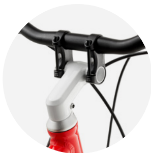
Wspornik kierownicy Vario w modelach woom 4, 5 i 6